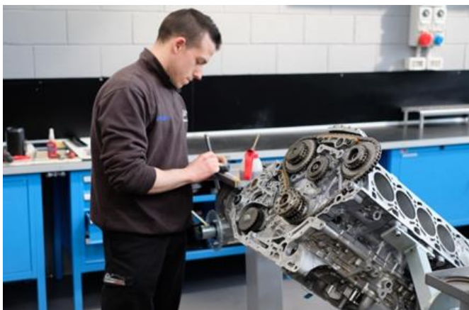
第47回 ティー・エム・パフォーマンス社(イタリア) 自動車部品メーカー、「パートナー企業が使用したエンジンの解析」