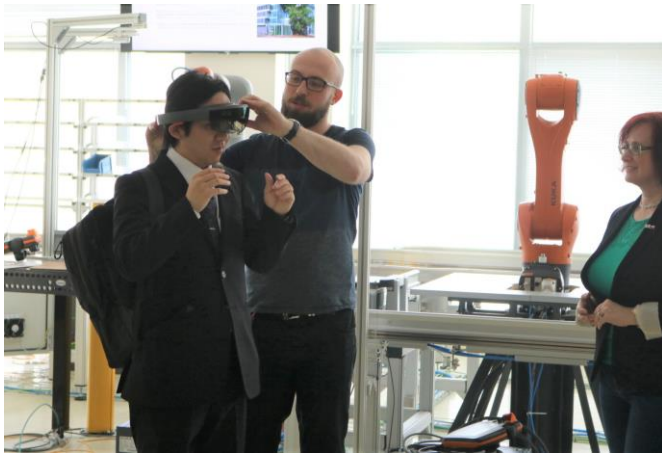
第48回 チェコ工科大学 CIIRC、大学所属研究機関 「VR機械の体験」(各設備の情報が表示される)