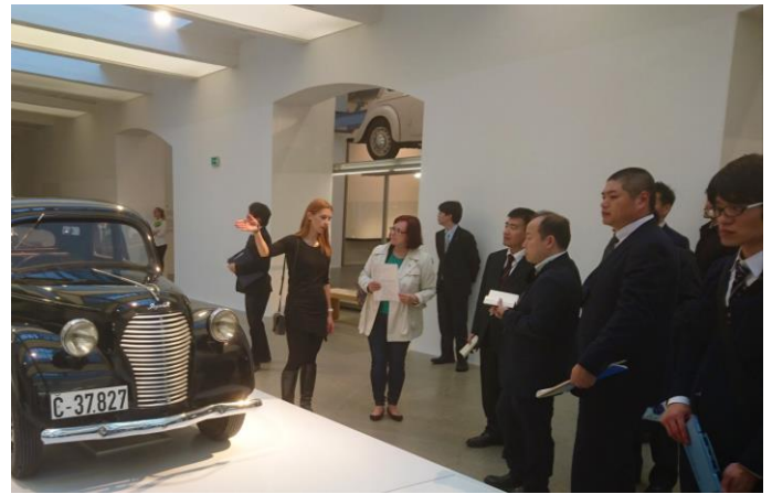
第48回 シュコダ・オート株式会社(チェコ) チェコ最大の自動車メーカー、「ミュージアムを見学」