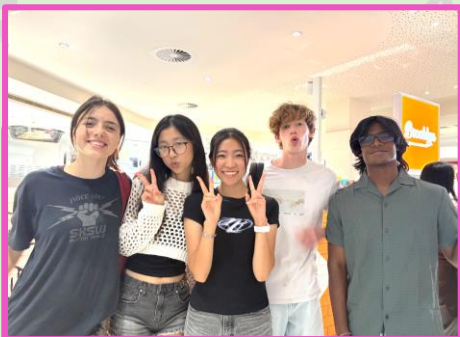
ローカルの生徒と