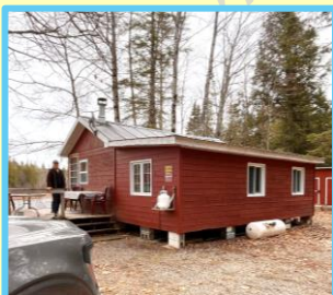
ホストファミリーの家

課外活動などには参加していましたが、田舎だったためそれ以外で英語を話す機会があまりありませんでした。その環境のなかでもホストファミリーと積極的に会話をし、ある程度は英語力を向上させることができました。