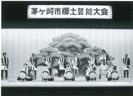
茅ヶ崎市郷土芸能大会

関東一円に分布する三四獅子舞が奥多摩から旧大島村に伝えられたのは、文化・文政(1804~1829)の頃といわれています。以来、村の鎮守である大島諏訪明神に奉納されてきた大島の獅子舞は、いわゆる「角兵衛流」の一人立ち三四獅子舞で、剣獅子・巻獅子・雌獅子・鬼面の4人の舞と、先導役の天狗、道化役の岡崎、笛と唄い手によって構成されています。毎年8月下旬、大島諏訪明神の例大祭に奉納されています。