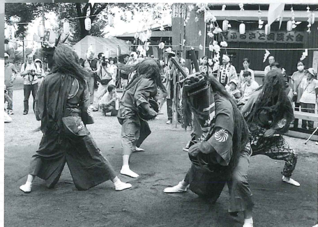
おおしま す わ みょうじん

移りゆく時代の中で、地域に暮らす人々に代々受け継がれてきた音楽や踊りや芝居などがいま、見直されています。神奈川県には、山村、農村、そして市街地にも、さまざまな民俗芸能が伝承されてきました。古くから土地に伝えられ、また移り住んだ方々の、忘れがたい故郷の舞踊など、豊かな神奈川県の文化遺産の中から、三つの芸能をご紹介します。